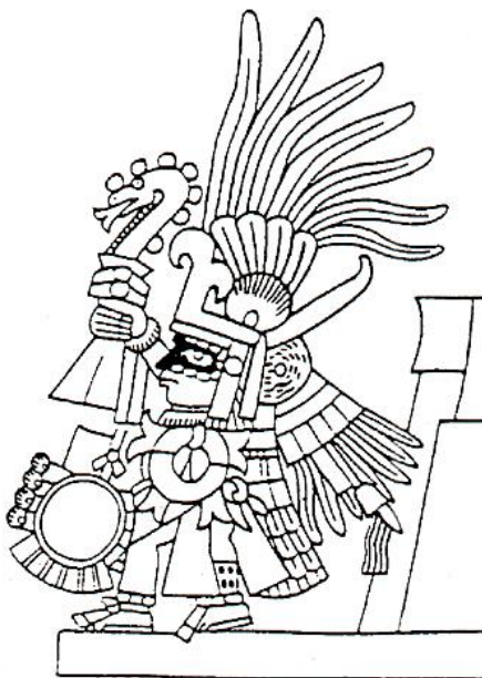
Wichtigster Gott der Azteken